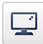
Pantalla Color TFT